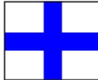
"X" Llamada individual