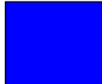
"Azul" Línea de llegada