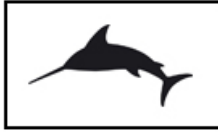
"Clase" Procedimiento salida