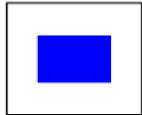
"S" Recorrido acortado